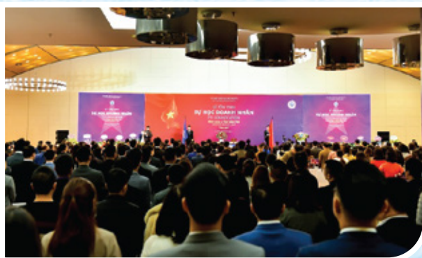
Lễ Tôn vinh sự học Doanh nhân: Khát vọng & tinh thần Việt lần thứ 20 ngày 09/01/2021 tại Hà Nội