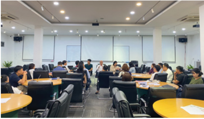
GIẢNG ĐƯỜNG AQUILA Phòng rộng 210m 2