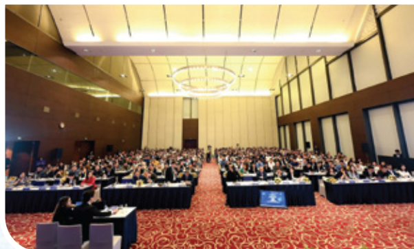
Năm 2023, hội thảo: “Kinh tế Việt Nam 2023: SMEs Đối diện & Vượt bão” với sự tham gia của khoảng 1000 đại diện doanh nghiệp tại 2 đầu cầu Hà Nội và Tp.HCM.