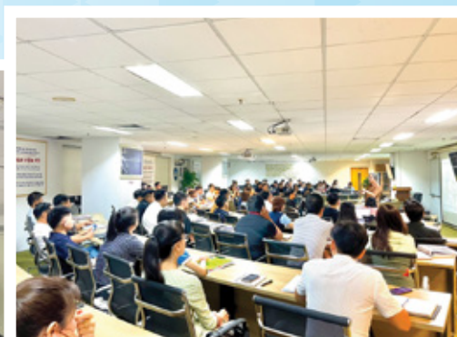
GIẢNG ĐƯỜNG CHU VĂN AN Phòng rộng 250m 2 / 130 ghế