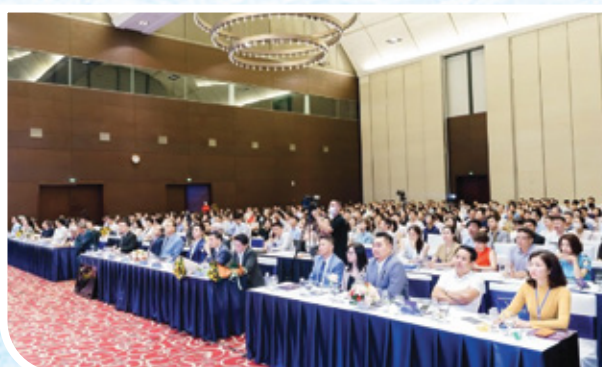
Năm 2022, hội thảo: “Diễn đàn kinh tế và doanh nghiệp 2022: Thích ứng và tự chủ” với gần 1000 thành viên tham gia tại HN và Tp.HCM.