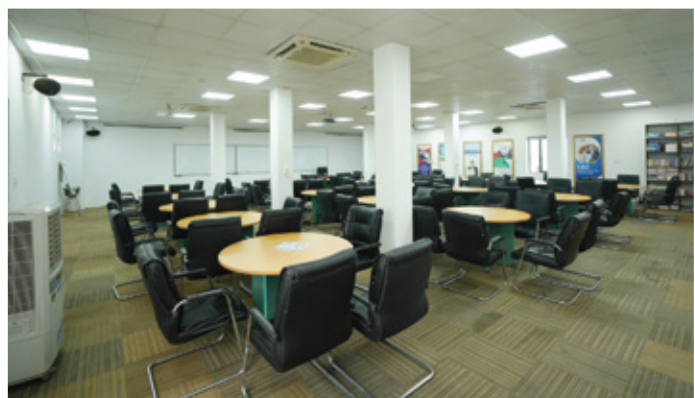
GIẢNG ĐƯỜNG CEPHEUS Phòng rộng 200m 2