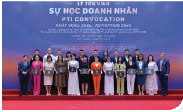
Lễ Tôn Vinh Sự Học Của Doanh Nhân lần thứ 24: ngày 17/06/2023 tại Hà Nội