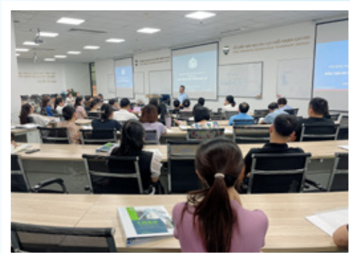
GIẢNG ĐƯỜNG GALAXY Phòng rộng 235m 2 / 120 ghế