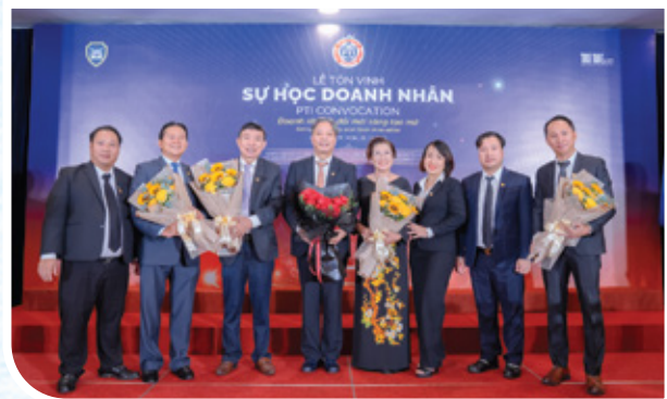
Lễ tôn vinh sự học Doanh nhân - Doanh nhân & đổi mới sáng tạo mở - lần thứ 23, ngày 29/10/2022 tại Tp. HCM