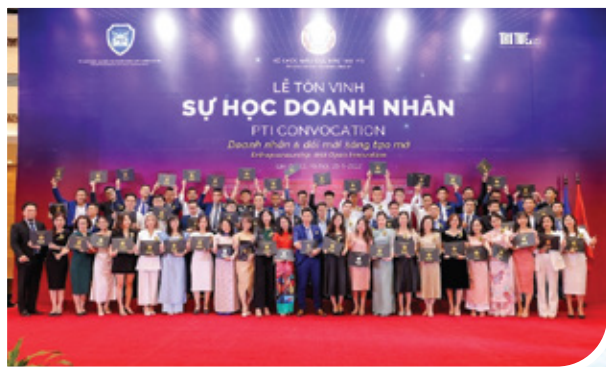
Lễ tôn vinh sự học Doanh nhân - Doanh nhân & đổi mới sáng tạo mở - lần thứ 22, ngày 25/09/2022 tại Hà Nội