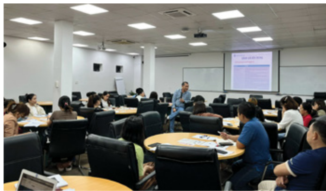
GIẢNG ĐƯỜNG DRACO Phòng rộng 200m 2