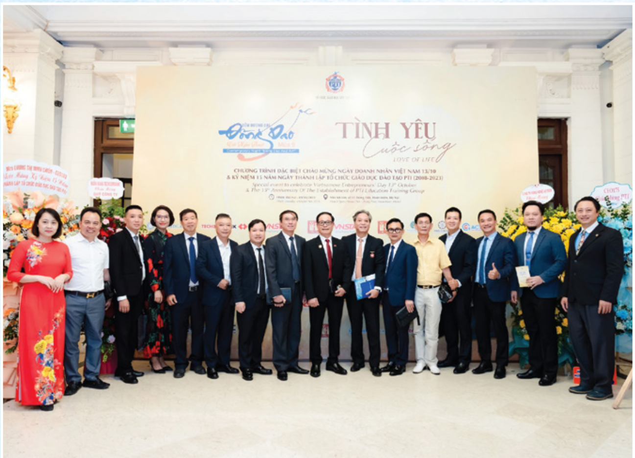
Đêm đương đại Đồng dao với nghệ thuật mùa 09: "Tình yêu cuộc sống" - Dấu ấn 15 năm PTI Ngày 09/10/2023, tại Nhà hát Lớn Hà Nội.