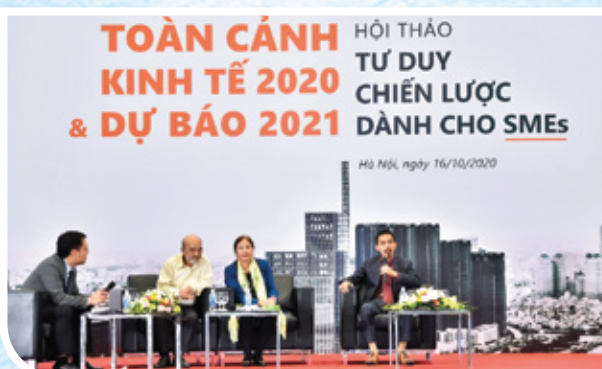
Năm 2020, hội thảo: “Toàn cảnh kinh tế 2020 và dự báo 2021 – Tư duy chiến lược dành cho SMEs” với sự tham gia của khoảng 1000 đại diện doanh nghiệp tại 2 đầu cầu Hà Nội và Tp.HCM.