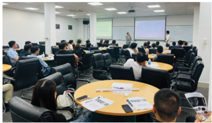
GIẢNG ĐƯỜNG CASSIOPEIA Phòng rộng 240m 2