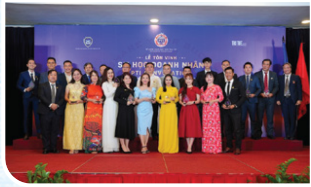
Lễ Tôn Vinh Sự Học Của Doanh Nhân lần thứ 25: Khát vọng 2045 ngày 24/06/2023 tại Tp. HCM