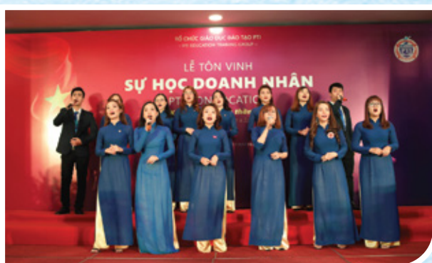
Lễ Tôn vinh sự học Doanh nhân: Khát vọng & tinh thần Việt lần thứ 21 ngày 17/01/2021 tại Tp Hồ Chí Minh