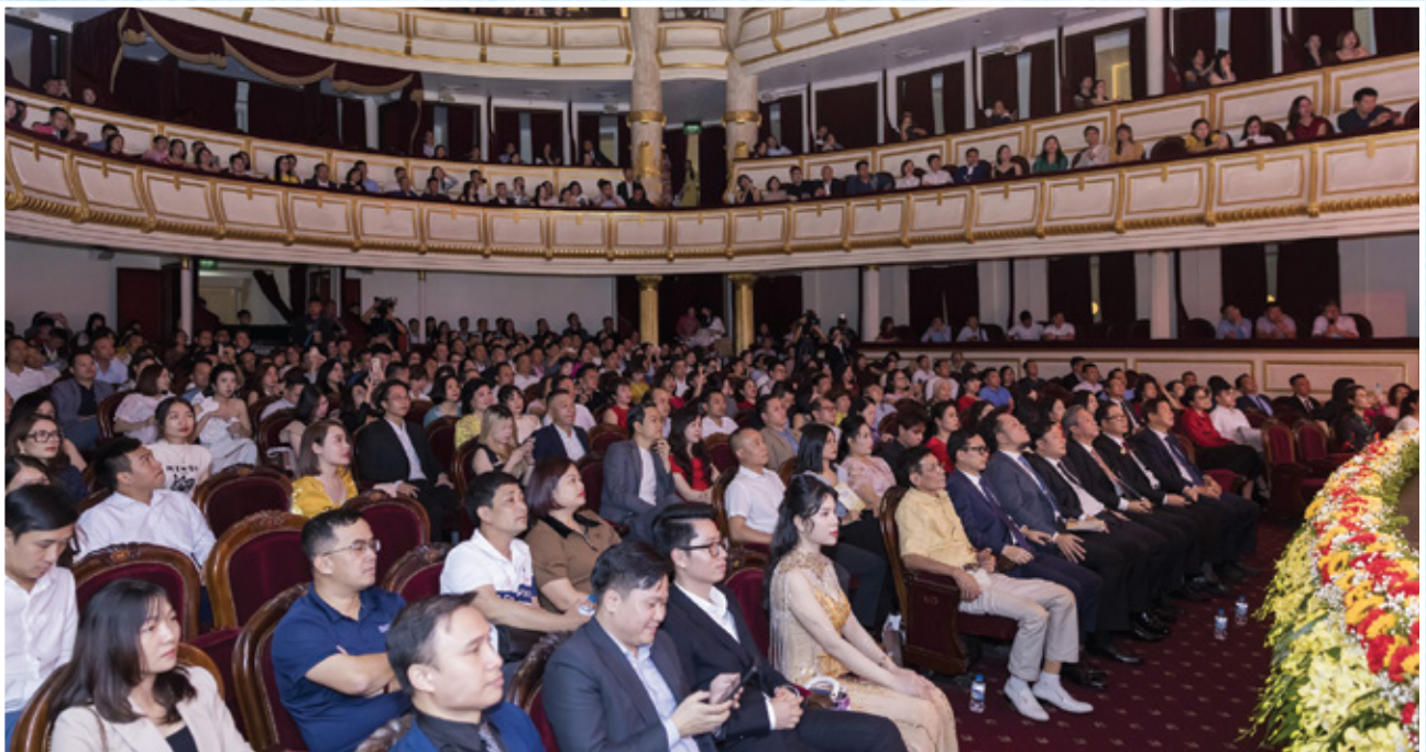
Đêm đương đại Đông dao với nghệ thuật mùa 09: "Tình yêu cuộc sống" - Dấu ấn 15 năm PTI Ngày 09/10/2023, tại Nhà hát Lớn Hà Nội.